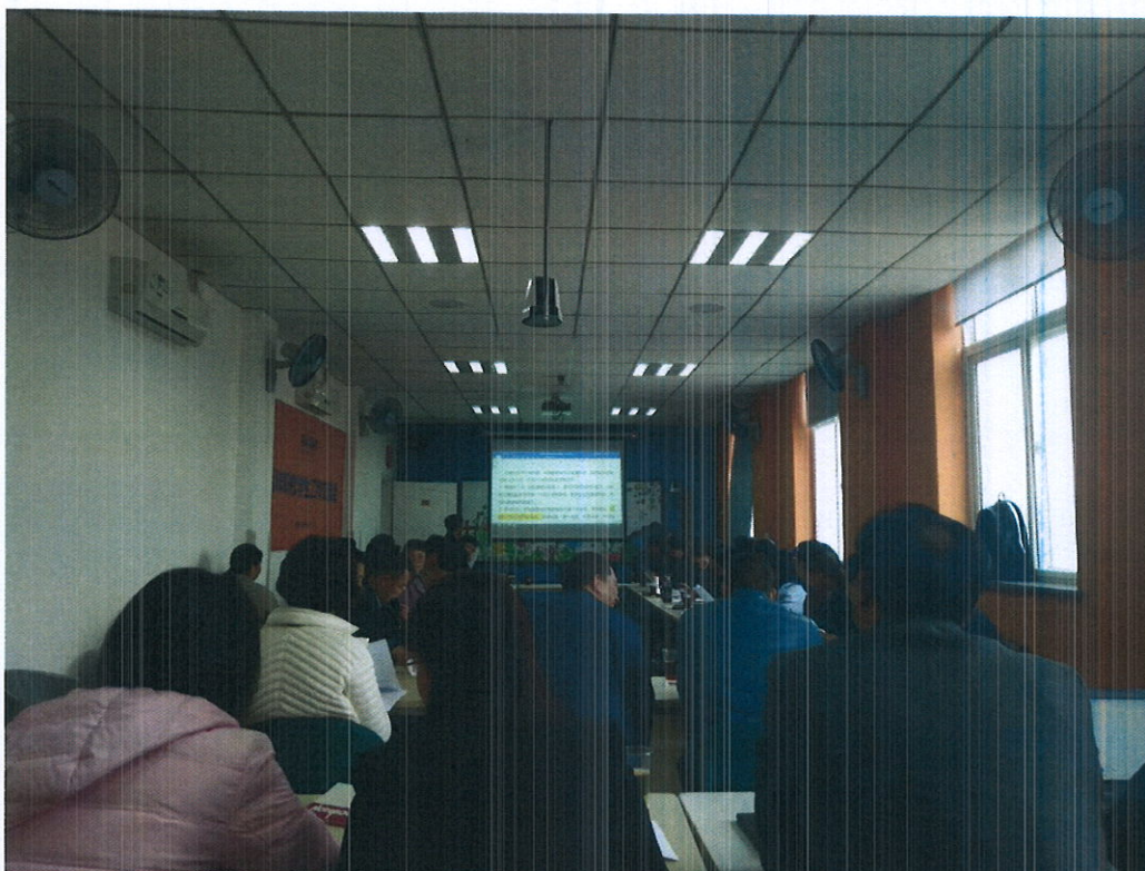
郑州百年学习交流会