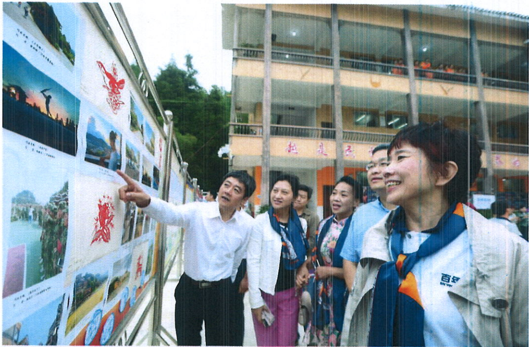
资助者参观雷山百年职校学生作品