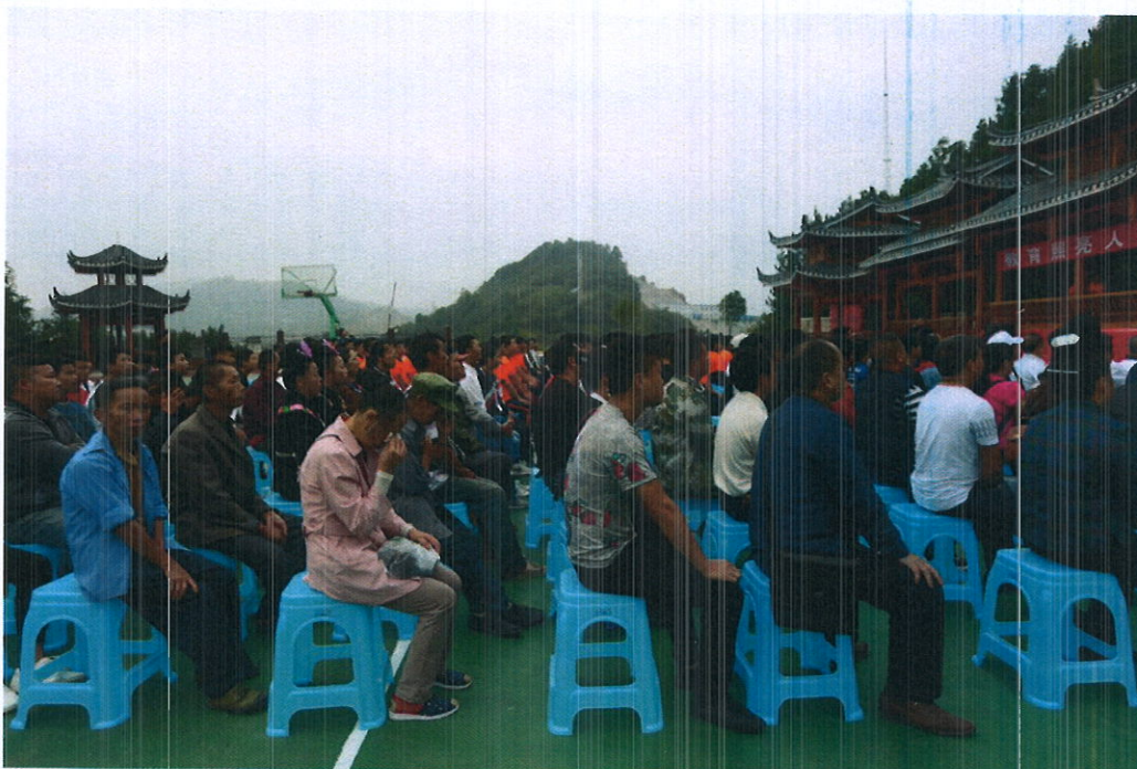
雷山百年首届开学典礼动容的家长