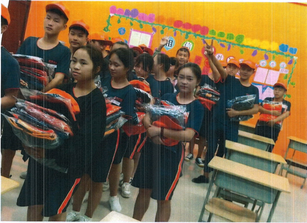
学生领取夏季校服