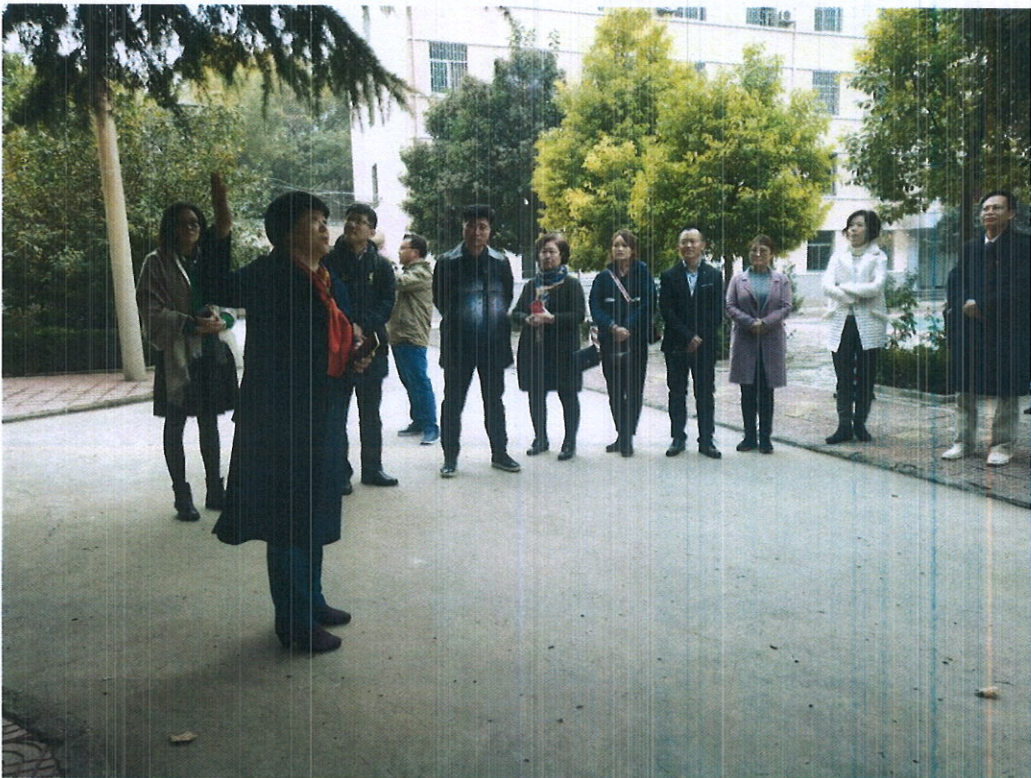
雷山百年教师代表到郑州百年学习