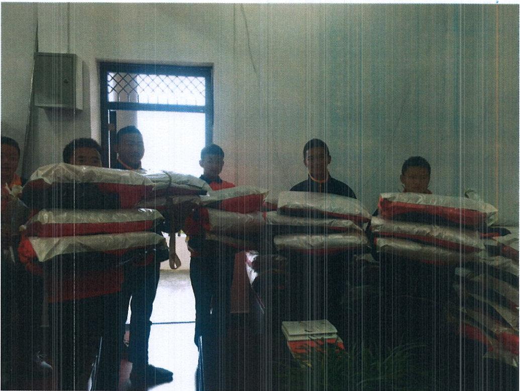
学生领取御寒冬季校服